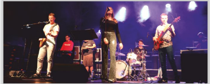
Zespół muzyczny Vamos