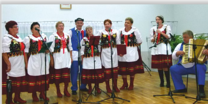
Zespół Śpiewaczy „Dworzanie” z Łubna