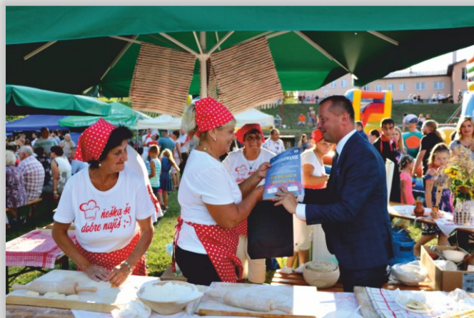
Podziękowanie dla KGW z Brezowicy