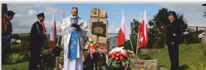
Złożenie kwiatów pod obeliskiem