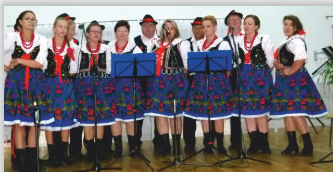
Zespół Śpiewaczy „Chorkowianie” z Chorkówki