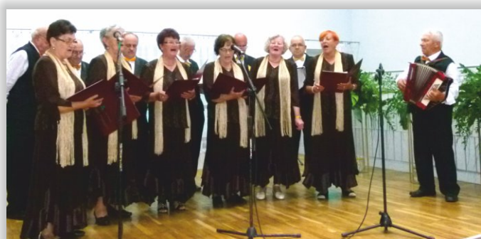
Zespół Śpiewaczy „Seniorzy” ze Świerzowej Polskiej