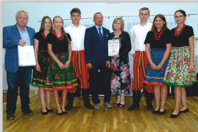
Grupa Artystyczna „Maskarada” z wójtem gminy, dyr. GOK i opiekunem