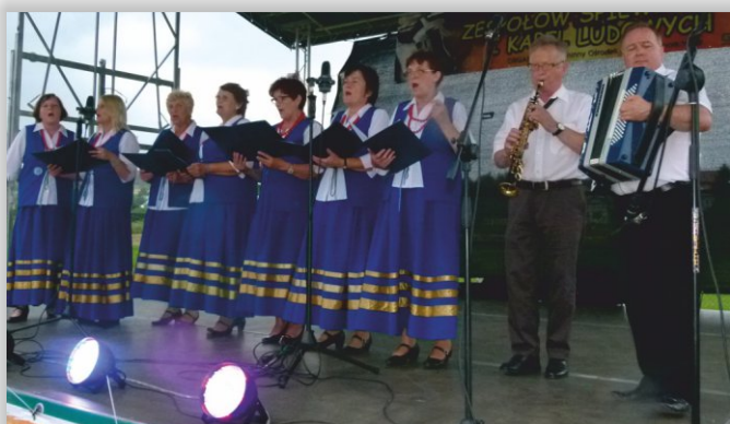
Zespół Śpiewaczy „Bobrzanie” z Bóbrki