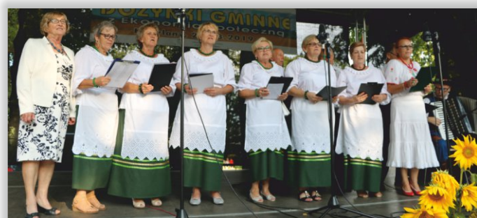
Grupa Wieńcowa z Kobylan