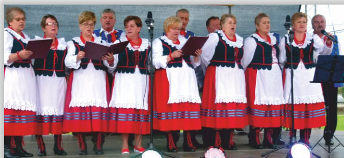
Zespół Śpiewaczy „Jutrzenka” z Kopytowej