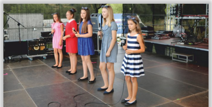
Zespół Wokalny, działający przy GOK-u w Chorkówce