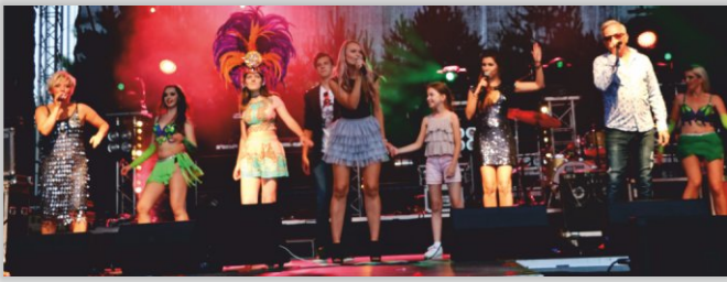
Zespół Cover Show