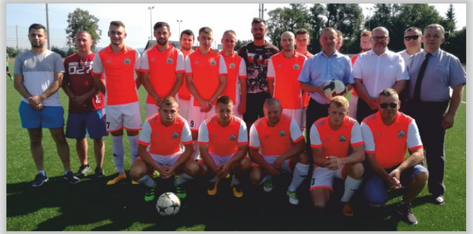
LKS Orzeł Faliszówka