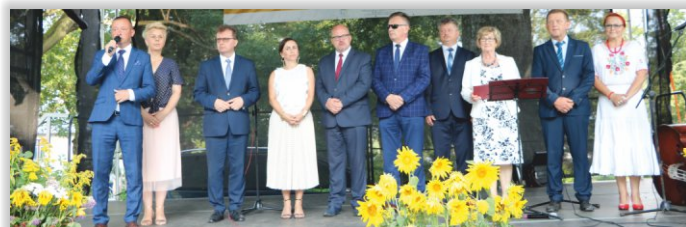
Przedstawiciele władzy w towarzystwie organizatorów