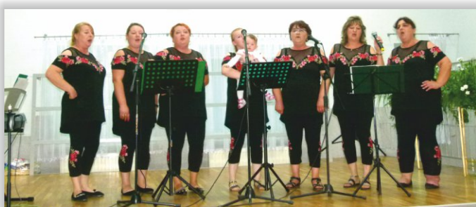
Zespół Śpiewaczy „Magnolia” z Podniebyla