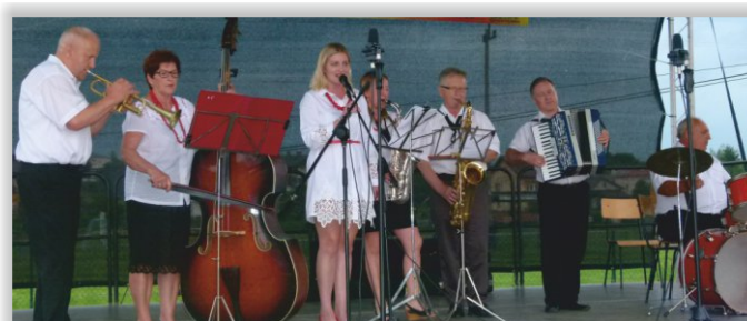
Kapela Ludowa „Ropiorze” z Bóbrki