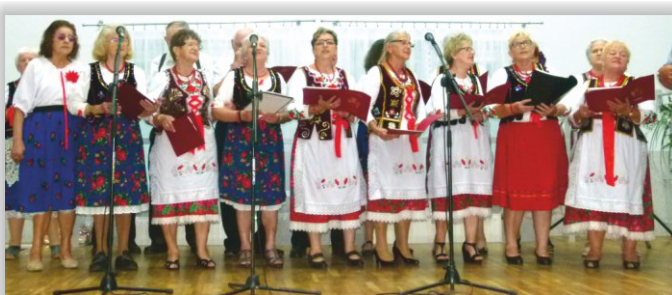
Zespół Śpiewaczy „Lesczanie” z Leska