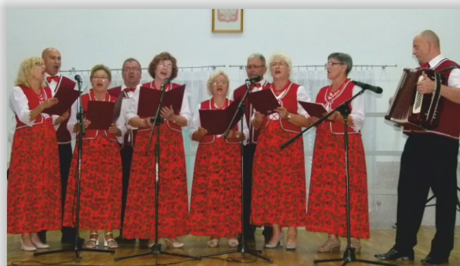
Zespół Śpiewaczy „Nadzieja” ze Zręcina