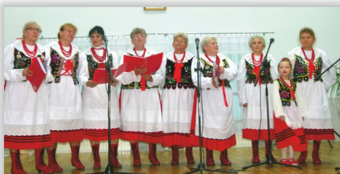
Zespół Śpiewaczy „Potakowianki” z Potakówki