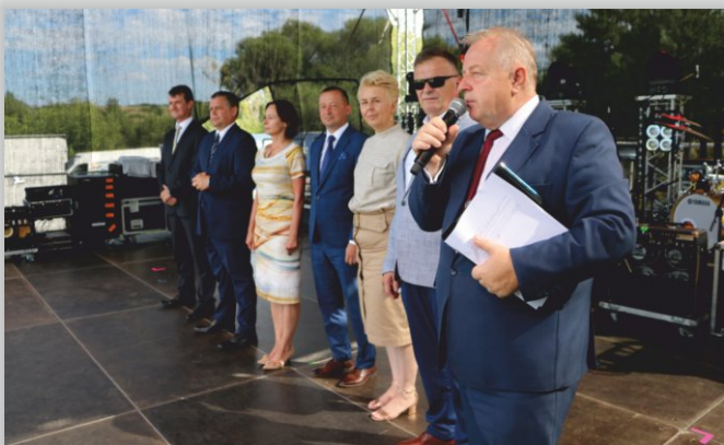
Przedstawiciele władzy wojewódzkiej, powiatowej i gminnej, a także zaproszenie goście i prowadzący