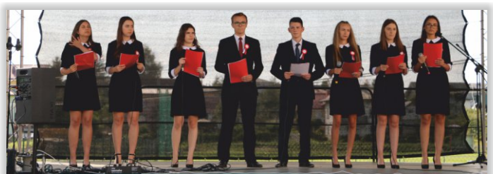
Grupa Artystyczna „Maskarada”