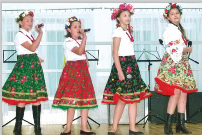
Zespół Wokalny, działający przy GOK-u w Chorkówce