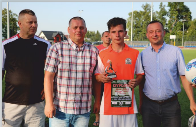
Dyplom dla najlepszego zawodnika