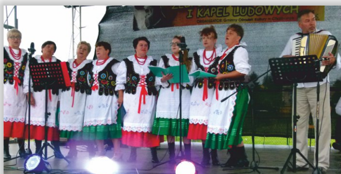
Zespół Śpiewaczy „Jarzębina” z Piotrówki