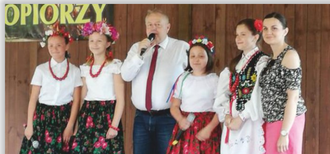
Zespół Wokalny, działający przy GOK-u w Chorkówce