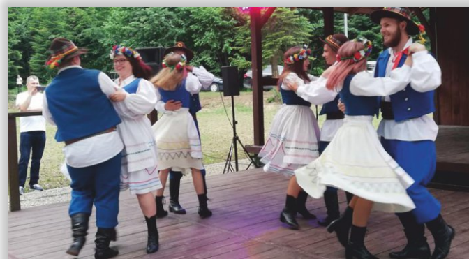
Ludowy Zespół Pieśni i Tańca „Bobrzanie” z Bóbrki