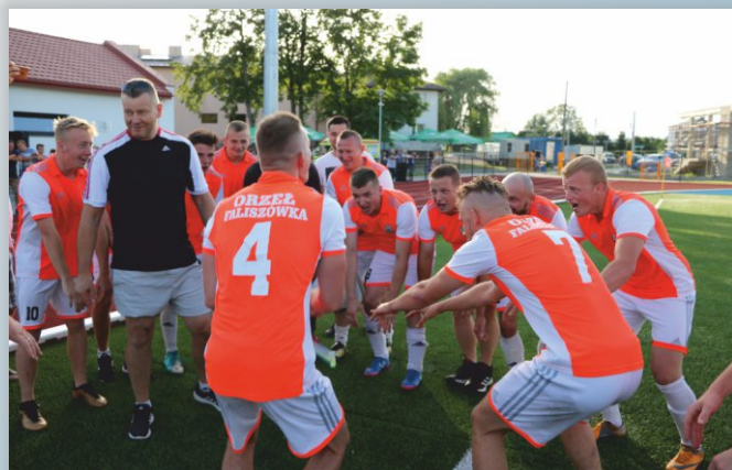
Radość ze zwycięstwa