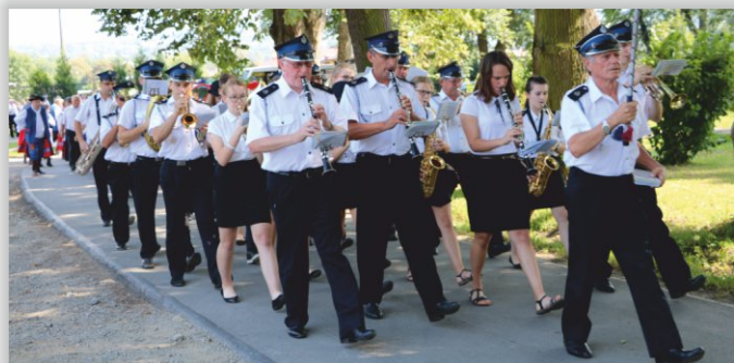
Orkiestra Dęta OSP Odrzykoń

dożynek było Stowarzyszenie Aktywności Lokalnej „Kobylany razem”, KGW w Kobylanach, Parafia, Rada Sołecka z Sołtysiem Wsi oraz GOK w Chorkówce. W przygotowaniu imprezy oraz w zabezpieczeniu pomagali członkowie OSP Kobylany. Podczas dożynek można było degustować potrawy kuchni regionalnej, przygotowane przez ▶