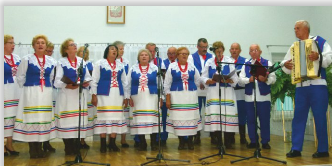
Zespół Śpiewaczy „Kamratki”, dział. przy RCKP w Krośnic