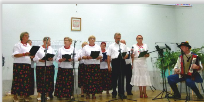
Zespół Śpiewaczy z Kobylan