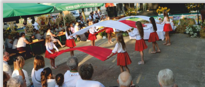
Występ uczennic ze Szkoły Podstawowej w Kobylanach