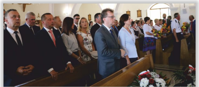
Uroczysta Msza Święta

Podczas spotkania uczestnicy mogli podziwiać wystawę przygotowaną przez Stowarzyszenie Eksploracyjno-Historyczne „Galicia”. ◀