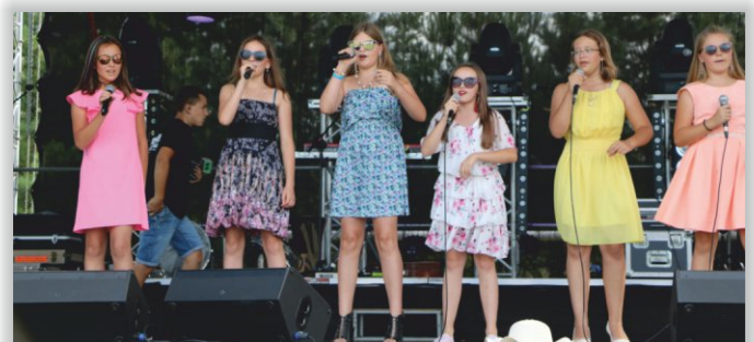
Zespół Wokalny, działający przy GOK-u w Chorkówce

Po koncercie gwiazdy na scenie zagościł zespół Vamos, składający się ▶